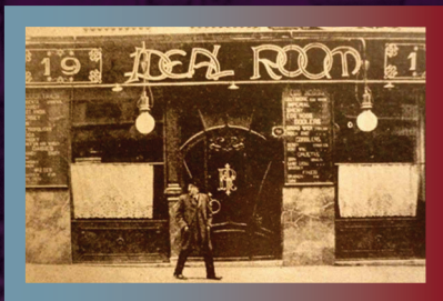
Café Ideal o Ideal Room. Històric café de València, en el carrer de la Pau, número 9, cantó amb el carrer de les Comèdies.