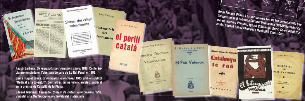
Faustí Barberà: De regionalisme i valentinitat , 1910. Conferència pronunciada en l'obertura de curs de Lo Rat Penat el 1902.

Amb localisme i universalisme. Amb efusió sentimental i racionalisme intel·lectual. Amb lleialtat tradicional i voluntat progressista. Tals foren els signes de la festa i l'enginy popular del carrer, al llarg del cicle anual: sant Antoni, les romeries primaverals, les Falles, les Fogueres, el Corpus, els Moros i Cristians, les Festes d'Agost... I es feren protagonistes al si de les bandes de música o els grups teatrals, els cinemes o els camps d'esports, les processons religioses o cíviques, els mitings o els aplecs reivindicatius.