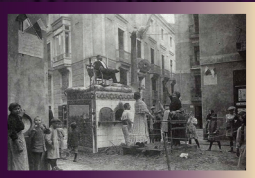
Falla Salvador-Libertat (1915). Crítica a la pujada del preu del pa i altres aliments bàsics.