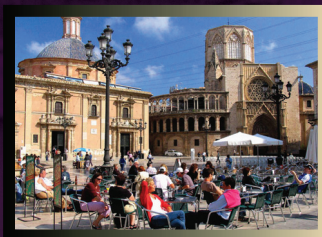
Terrasses de bars i cafés de la plaça de la Mare de Déu de València.