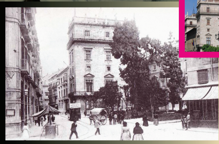
Generalitat Valenciana. Antiga Seu de la Diputació Provincial de València, on l'any 1915 es va crear el Centre de Cultura Valenciana.