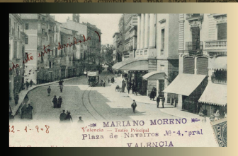
Teatre Principal de València (1909). La màxima escena contemporània de l'espectacle, la música i les celebracions civils valencianes.