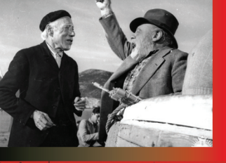
El escenari del Principal, con Calabuch (1956). Pel·lícula dirigida per Luis Garcia Berlanga, entre el costumisme i el surrealisme, ubicada a Peníscola.