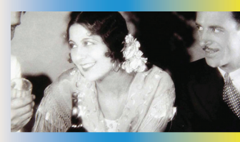
El Piquer. Concha Piquer, una de les cantants de còpia més importants del segle. Els valencians no ignoren, entre els seus èxits, el de La Maredueta .