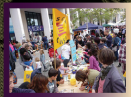
Imatge d'una de les festes per la llengua organitzades per Escola Valenciana en totes les comarques.