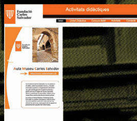
Fundació Carles Salvador (Benassal).