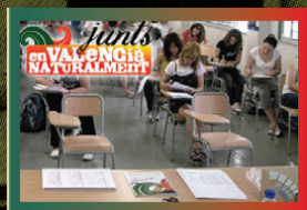
Fotografia d'examen de la Junta Qualificadora de Coneixements de Valencià, de la Conselleria d'Educació i Cultura de la Generalitat Valenciana. Les cadirees buides s'esperen.

La llengua està present en tots els nivells educatius, des de l'ensenyament infantil al de les universitats. I cal mantindre la fecunditat cívica dels temps de Carles Salvador: els cursos emblemàtics de Lo Rat Penat (des del 1949), els "Cursos Carles Salvador" d'Acció Cultural del País Valencià han format, des del 1976, més